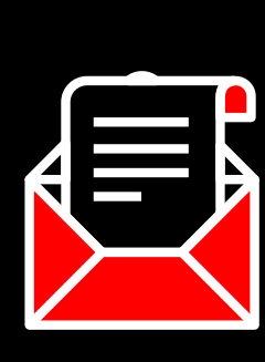
Código de ética y de Conducta

Implementado y fortalecido bajo el ciclo de mejora continua