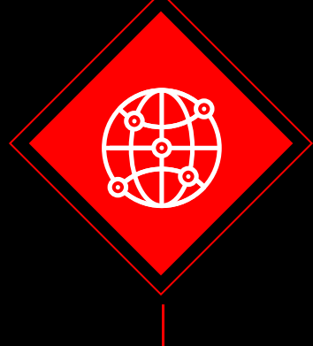
Riesgo de Contagio