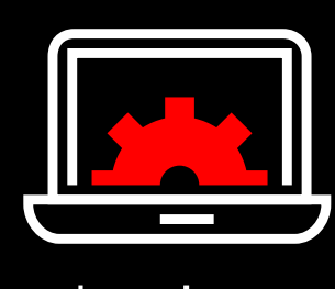
Recomendaciones y mejores prácticas internacionales

Permite gestionar y mitigar riesgos asociados a laft: